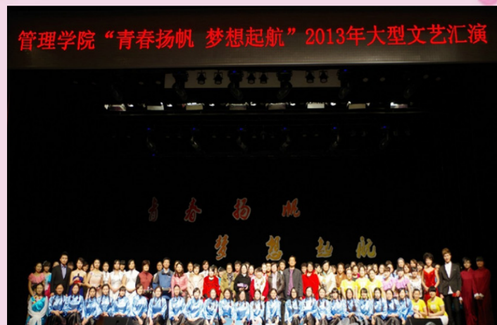
12月3日管理学院“青春扬帆 梦想起航”2013年大型文艺汇演圆满举办。