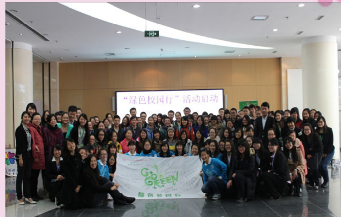
11月16日中华女子学院“绿色校园行”活动启动仪式圆满成功！