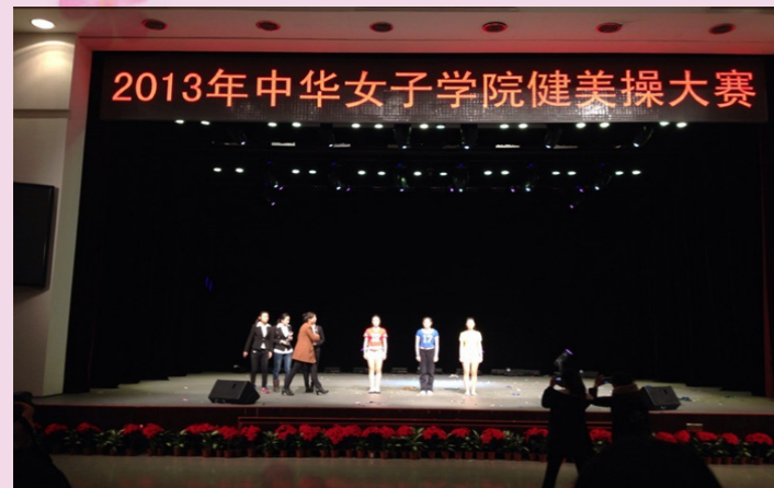
11月26日中华女子学院健美操大赛顺利举行，管院喜得第三名。