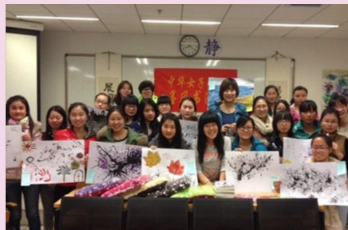
11月30日吹墨创意涂鸦大赛圆满举行。